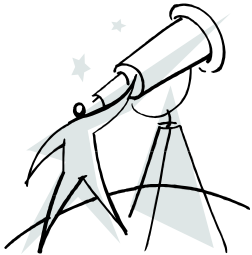
Caption describing picture or graphic.